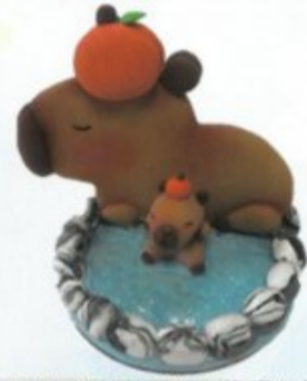
高雄市社教館提供(講師作品)

在這短暫的三小時裡，看著一團一團不起眼的黏土，被不停地混合搓揉、擠壓伸展，彷彿被來參加活動的親子施予神奇魔法般，最後竟變成療癒的卡皮巴拉。