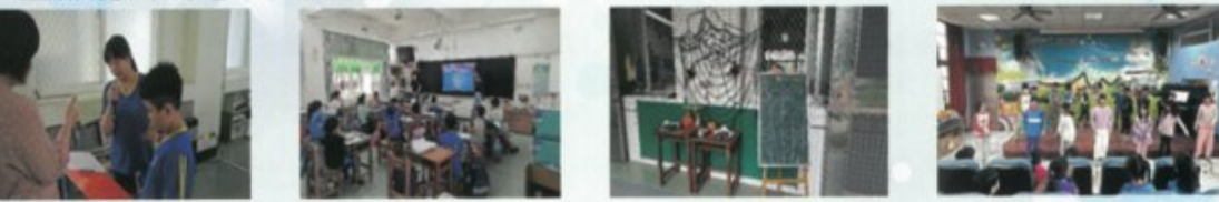
午餐時間英語廣播

英語教學已邁向應用、互動與多元文化的整合。透過「下課十分鐘說英語」的日常積累、「英語日」的趣味應用，以及「外師來校上課」的真實情境，學校正積極為學生們編織一張全面且生動的英語學習網絡，讓每位學生都能自信地以英語溝通，成為具備國際視野的世界公民。