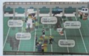
梓官區漁會拍賣示意圖