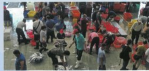
理貨員和秤重員工作情形，承銷人搶先在一旁觀察漁獲。