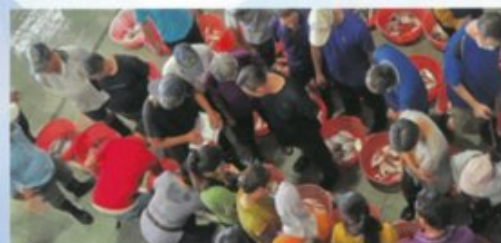
拍賣員和承銷人競拍漁獲情形。