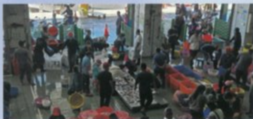
漁貨主卸貨和理貨員分級分籃工作情形。