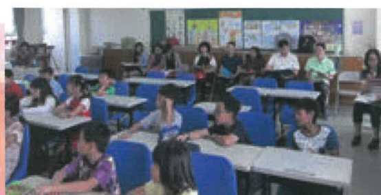
觀課班級:四孝 地點:英語教室 上課內容:tall、short、fat、thin之教學