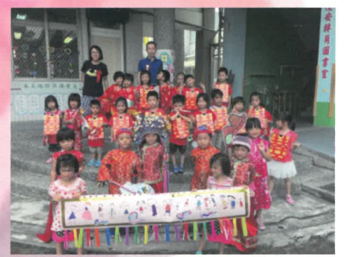
太陽班迎親隊伍與校長、人事主任合影