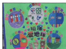
六孝 陳嘉緯 李瑀瑩 張俊賢 鄭萱樺