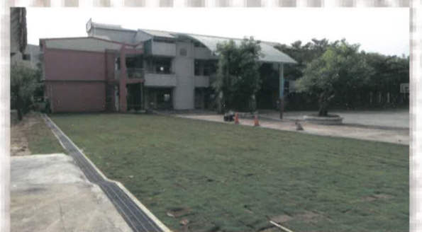
圖二：拆除後整地植草