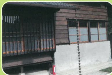
副廠長宿舍的【鎖桶】