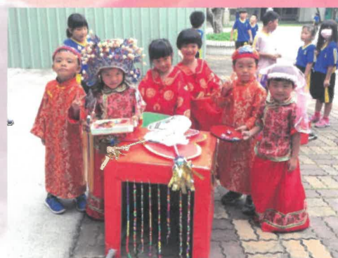
太陽班兩對新人與自製花轎合影