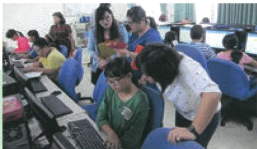
觀課班級:五忠 地點:電腦教室 上課內容:國小核心英語單字教學