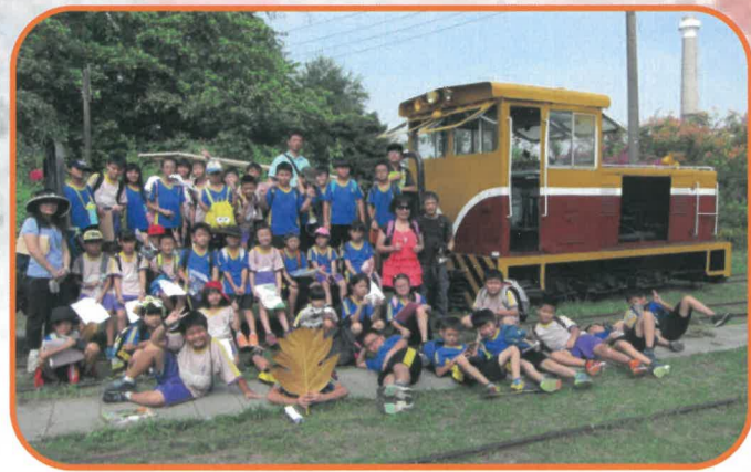
台英主任、志鵬導覽老師與郁甄、旭昇、正武導師在具有特色的五分車前合影