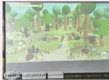
同伴們加油！很快就會建好房屋了。