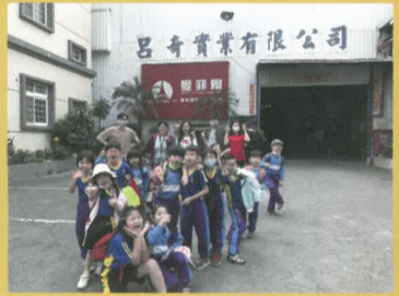
拜訪呂奇家具，老闆全家親自接待，並為小朋友準備了許多可口點心。