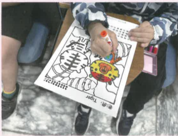
將自己喜歡的角色上彩妝

高雄市立圖書館阿蓮分館於本校辦理~以「AR遊戲體驗課程」讓學童透過科技互動的學習，體驗數位閱讀的樂趣。學童透過數位閱讀AR遊戲體驗課程，體驗不同以往的閱讀形式，透過AR互動方式，學童身臨其境，讓閱讀更生動有趣。