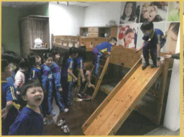
溜滑梯床組是小朋友的最愛