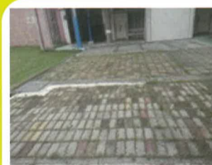
現在進行式(112. 10. 10)