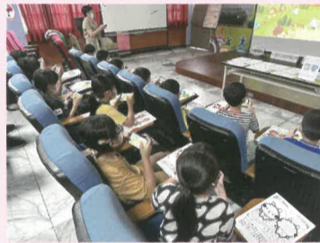
專注自己的角色，努力完成故事中的任務。