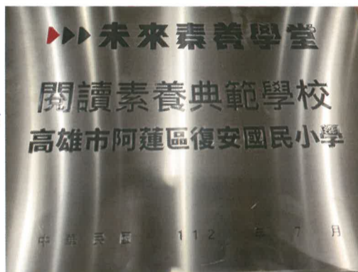
閱讀素養典範學校牌匾，找找看它在學校裡的什麼地方