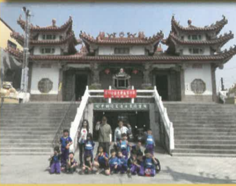
拜訪玉庫社區，和藹可親的莊理事長親自接待小朋友並擔任導覽員。