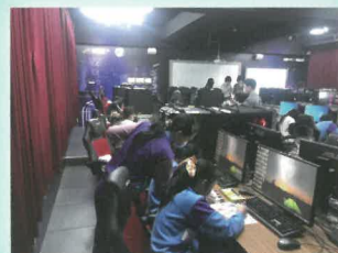
大家相互觀摩圖案角色，並努力創作。