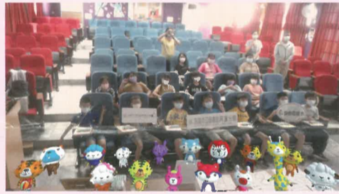
三年級同心協力完成艱鉅任務