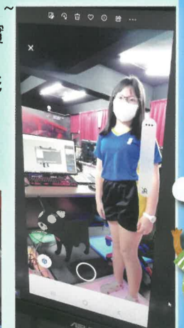
跟著寵物狗來個合照