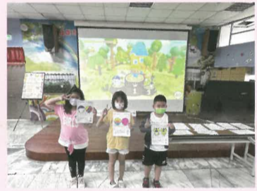
三年級勝利玩家表揚