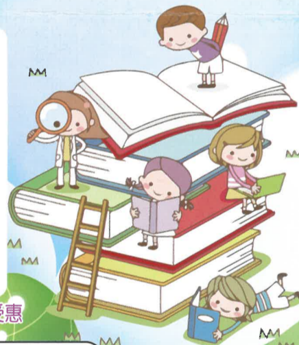
第一至第三屆閱讀典範學校已遍佈全台，共33所學校3000多名學生受惠