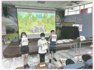
四年級B場勝利玩家表揚