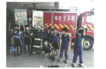
同學與小小消防員合影