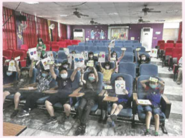
四年級與自己的夥伴大合照