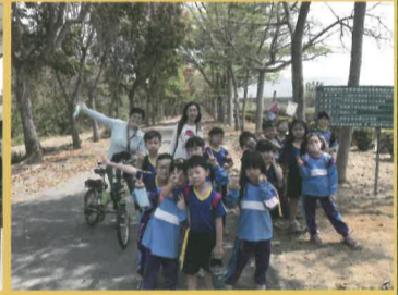
老公堀圳休閒步道景色優美，讓人心曠神怡。