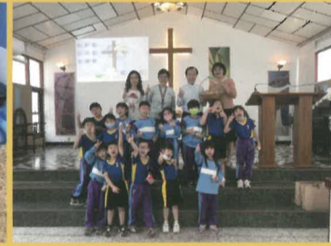
大家比個讚，來個大合照。