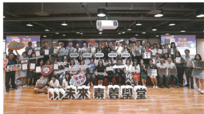
第一至三屆閱讀素養典範學校們大合照