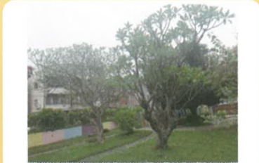
現在進行式(112. 10. 10)