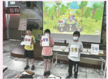
四年級A場勝利玩家表揚