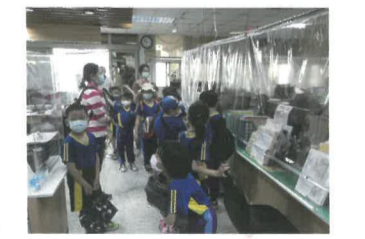
區公所秘書親自為大家解說所內業務，同學也了解生活中很多事情原來與區公所息息相關。