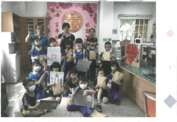
戶政機關的體驗，讓大家都著深刻的回憶。