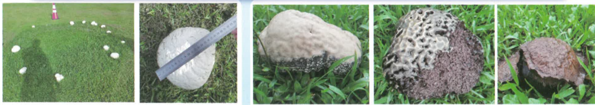
110年6月4日紀錄、最大直徑近18公分。

生長期很短，且只有連續下雨多日的梅雨季節才會出現，請只用眼睛觀察，勿故意破壞，讓大家都可以觀察到該菇類完整的生長週期，也可以記錄該菇類可以長到多大，謝謝您的配合。