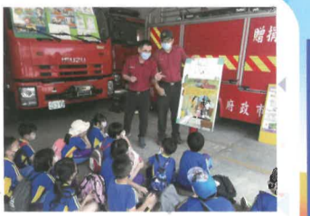
阿蓮消防隊長親自為大家解說防災的重要性。