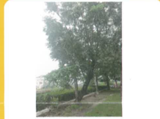
現在進行式(112. 10. 10)