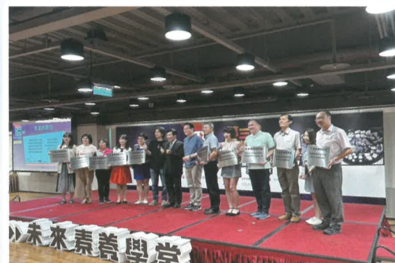
第三屆未來素養學堂教育松甄選活動獲獎學校