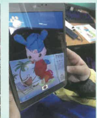
利用平板觀看成果