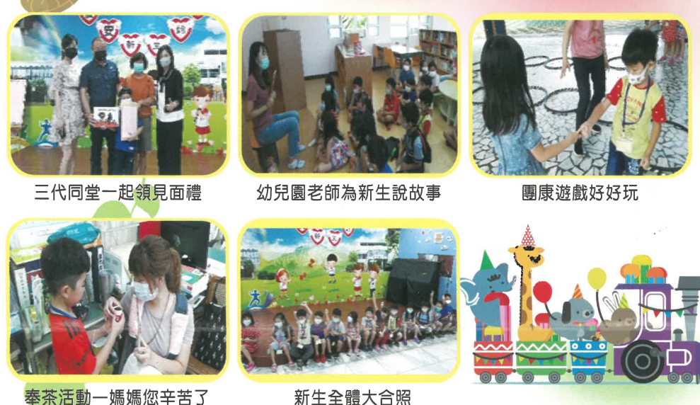
三代同堂一起領見面禮