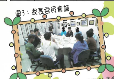
圖3: 家長委員會會議