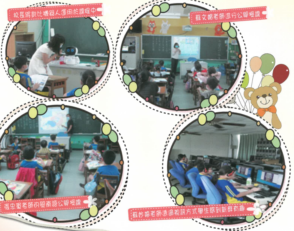
校長將凱比機器人運用於課程中

本校擔任新課綱課程授課教師(含校長)，每學年至少公開授課一次，並以校內教師觀課為原則。目前已逐年實施至二年級。