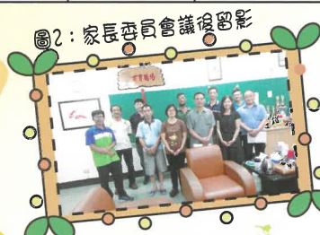
圖2: 家長委員會會議後合影