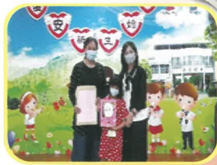
校長致贈新生見面禮和繪本