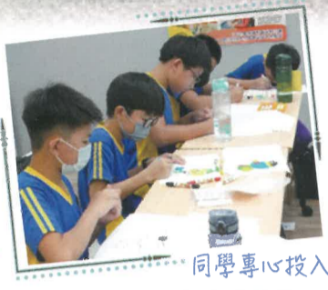
同學專心投入 動漫構圖與上色