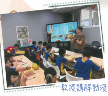
教授講解動漫製作過程