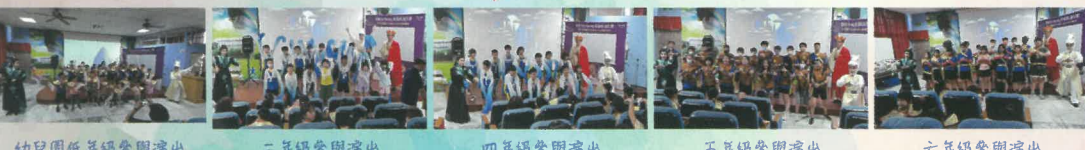
幼兒園低年級參與演出 三年級參與演出 四年級參與演出 五年級參與演出 六年級參與演出