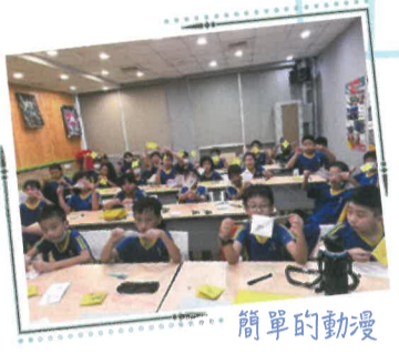
簡單的動漫 成果展現