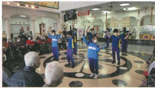
※復安國小高年級學生到阿蓮區淨覺安養中心進行公益演出(萬海慈善贊助) 淨覺安養中心進行公益演出(萬海慈善贊助)

學校表示，考量目前學區人口逐漸外移和人口老化，希望藉由這次萬海慈善基金會贊助的公益演出，讓這群孩子走進社區服務及關懷長者，展現平日在校所學直笛、扯鈴及唱歌舞蹈，積極參與社區公共事務，進而建立公民意識，讓孩子了解到，年紀輕輕的他們不是只有被服務，透過一己之力，小朋友也能服務他人 同時展現才能，引導孩子省思社會責任的意義身為社會的一份子，從小就積極參與公共事務，保有感恩和回饋社會的心，對周邊的人事物多一份關心與愛。