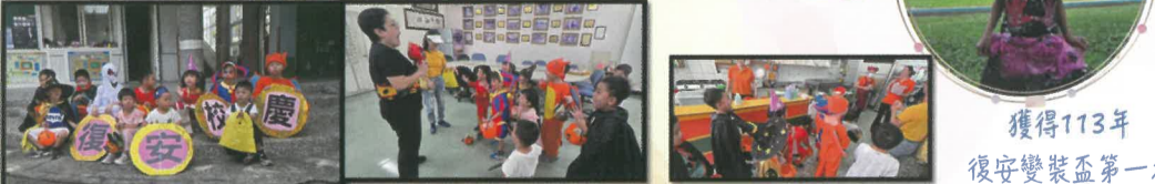
獲得113年復安變裝盃第一名