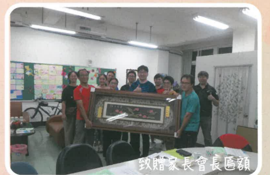
致贈家長會長匾額