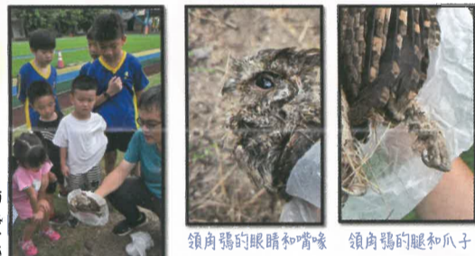
領角鴉的眼睛和喙 領角鴉的腳和爪子

113年10月28日，第一節下課，學生跑來說操場圍牆邊有貓頭鷹屍體，於是拿塑膠袋去處理，觀察發現這是隻年輕的小「領角鴉」，體長約22公分，趁機向學生介紹貓頭鷹的特徵，有大大眼睛，有利於夜間搜尋獵物；粗壯的腳和尖銳的爪子可以緊抓獵物不放；彎勾的上喙有助於撕裂進食；柔軟的羽毛讓飛行變的寂靜無聲。牠是台灣海拔最低和最接近人類的貓頭鷹，非常適應人為改變過的環境，在阿蓮國中和阿蓮國小操場旁的樹木上，都曾發現有領角鴉的幼鳥，但也因此，幼鳥離巢時受到干擾致死的消息也時有所聞。「領角鴉」被列為珍貴稀有保育類野生動物，以小型哺乳類和昆蟲為食，會吃老鼠、青蛙、蜥蜴……等，至於此次死亡的原因，因年輕無外傷，昨天天氣也只短暫下點小雨，那就讓我想起前幾日，有無人機進行噴灑農藥，猜測或許牠是誤食被農藥毒殺的獵物吧！