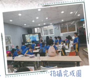
拍攝完成圖 並製作成動漫影片