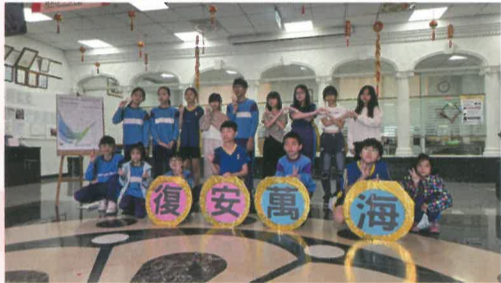
※復安國小六年級直笛隊學生到阿蓮區淨覺安養中心進行公益演出(萬海慈善贊助) ※復安國小六年級學生到阿蓮區淨覺安養中心進行公益演出(萬海慈善贊助)

屬於偏遠學校的復安國小，目前六年級畢業生只有16位，學校希望藉由辦理多日長途外宿型戶外教育活動，讓學生有不一樣的北部旅遊體驗機會，但考量學生負擔畢業旅行費用較高，因此學校去年向萬海慈善基金會申請熱氣球升空計畫，並獲得補助，今年畢業生也很期待這次的北部畢業旅行。