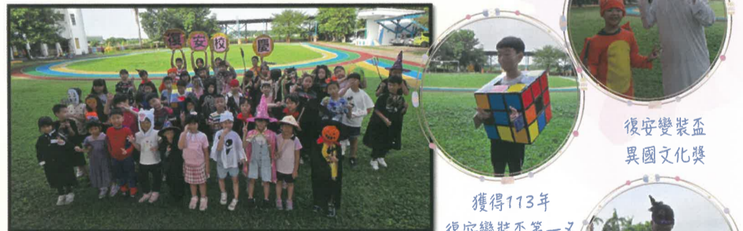
復安變裝盃 異國文化獎