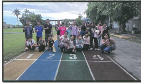
113/5/31出發前於校內合影(18:30)

今年活動於5月31日晚上辦理，共有13位學生、4位家長和5位師長一起參與。學生親子們於晚上6:30於校門口集合出發，趁著天色未暗，趕緊來張大合照，紀念這難得的體驗活動，不知道今晚能否看到大家期待中的蛇蛇、獨角仙……。