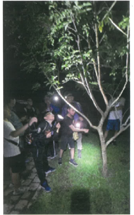
113/5/31於生態池觀察獨角仙(19:30)

回程途中，大家停留在茶坊旁，從高處俯瞰大崗山下的平原，各自尋找復安國小、天山營區、同學家的所在位置，遠處高鐵車廂穿梭黑夜疾駛而過，更是引起大家的驚呼。最後六年級的同學們和導師為今晚夜間觀察，留下美好的回憶。