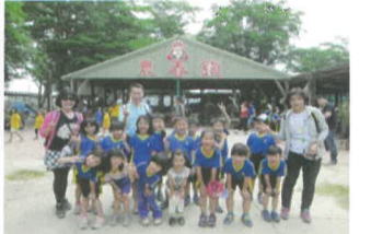
校長、台英主任、文媚導師與小朋友們合影於農春鎮