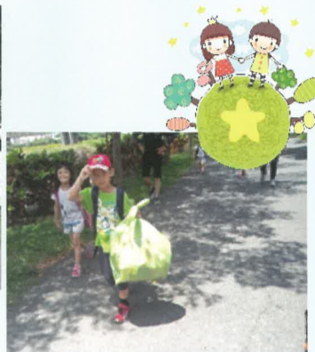
社區淨街活動—孩子主動撿拾垃圾