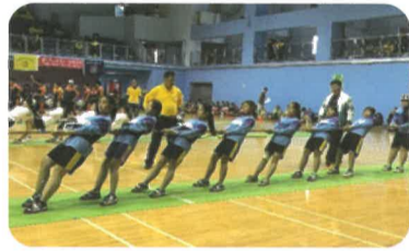
女生組對抗金沙國小