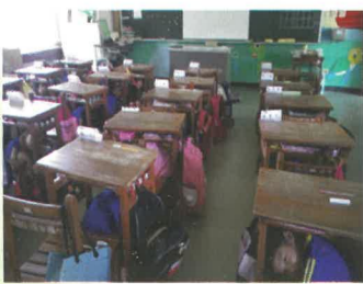
一年忠班避震演練