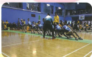
男生組對抗述美國小