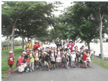
玉庫巡禮—全員合影留念