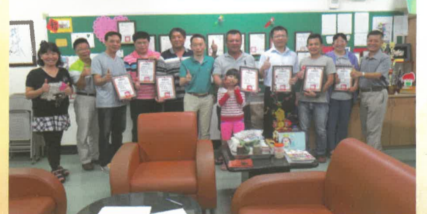
107年10月3日家長委員會留影