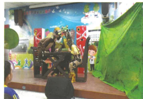
其他動物也來吃美食