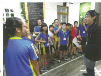
老闆和學生解說今天的活動內容

下午的體驗, 兒福聯盟規劃邀請國軍高雄總醫院護理師, 到學校教小朋友如何自救及救人的技能體驗活動。