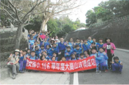
校長、台英主任、美娟理事長與師生們合影於大崗山