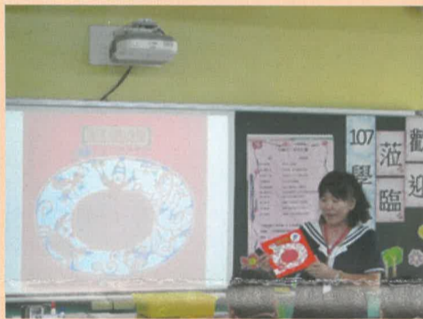
尹台英主任介紹繪本進入閱讀世界及宣導重要教育政策