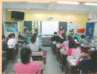
葉淑慧導師說明班級經營理念及進行親師交流