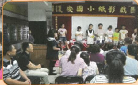
終於看到演迎新紙影戲的四忠小朋友們廬山真面目