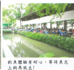
釣魚體驗有耐心, 等待魚兒上鉤再放生!