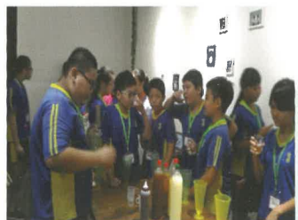
老闆調好果汁學生開始試喝