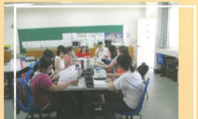
在校長們的引導下進行議課, 種子教師們熱烈分享