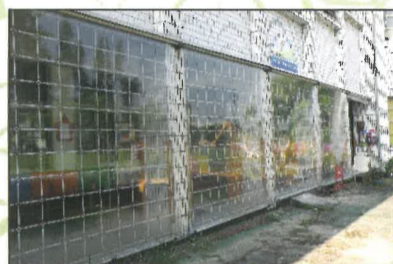
圖C：縱橫畫格的幾何透明帆布面

捲帆：每年十二月、一月東北季風吹襲，常令人寒顫及打哆嗦；又五、六月的梅雨季，細雨斜風的屋簷下，幼兒園走廊被雨濺的濕淋淋。自從這捲帆做好後(圖C)，平常日防雨帆往上收捲，遇到下雨或冷風、強風吹襲，放下捲雨帆；在巧見縱橫畫格的幾何圖形，透明帆布面下，格外引人注目。不但達到防風防雨之功能，又營造另一種空間視覺之美，不經意凝視，常目不轉睛多看一眼。