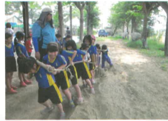
我們卯足全力, 拖牛犁體驗真難得!