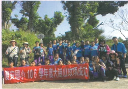
攀爬至312公尺的大崗山至高點, 我們攻頂成功了!