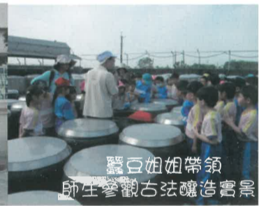
蠶豆姐姐帶領師生參觀古法釀造實景