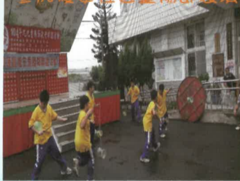
參加小可愛幼兒園目擊節活動表演