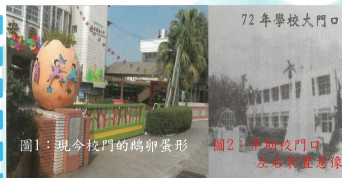
圖1：現今校門的鵝卵蛋形

營造空間美學的故事，可從校園歷史軌跡出陳佈新賦予新生命；亦可從社區在地的題材，豐富它人文的教育性；有些是實物的圖騰；有些是靜態畫面，抑或是在動態進行中的事件，將它整理記錄再重新編輯，轉化成彩繪牆；變化成詩詞步道；抑或是在以實體建物意象傳達，不一而足。詩人常說，每個人內心都有自己一處桃花源；教育家也說，環境改變了，人也會隨著改變，這種耳濡目染的潛在課程境教，魅力無窮，常沁入心脾，影響人心。挖掘及建構在地性的空間美學故事，展現人文涵養的深度，有視覺的美，有心靈的感動，兼具傳承及啟發，當下烙印人心，並勾勒出屬於團體共同的記憶。