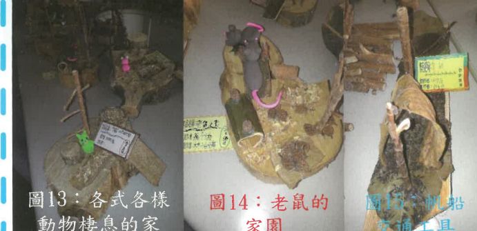
圖13：各式各樣動物棲息的家