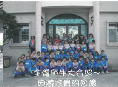
全體師生大合照~典藏珍貴的回憶