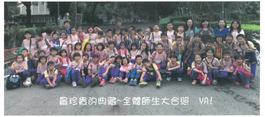
最珍貴的典藏~全體師生大合照 VA!