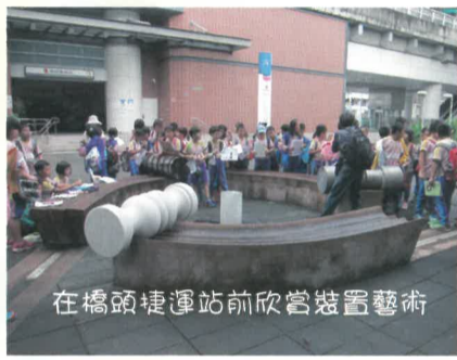
在橋頭捷運站前欣賞裝置藝術