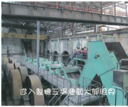
進入製糖工場參觀大開眼界