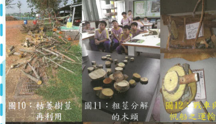
圖10：枯萎樹莖再利用