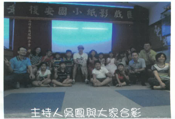
主持人吳鳳與大家合影