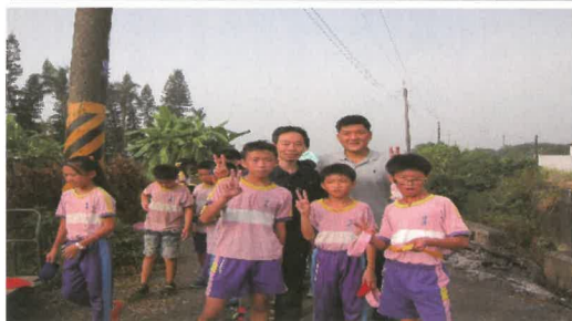
六年級男生前三名