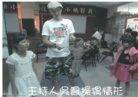
主持人吳鳳操偶情形

期待已久的「玩客瘋高雄」節目主持人吳鳳要來學校錄影，要把我們學校的特色，紙影戲介紹給全國觀眾知道，有這大好機會是復安的榮幸。時間早就決定在7月8日(三)，錄影的前一天全台又是風又是雨，很怕無法錄影；當天上午，他們在湖內的大湖社區錄影，上午的天氣不是很穩定，所以，在下午3點多才來到學校，我們歡迎他們的到來，隨即到紙影戲館準備錄影事宜，長明老師及四忠演出同學已準備好了，校長簡單介紹節目主持人吳鳳先生後，吳鳳拿著長明老師為他準備本人的紙偶，用不大標準的華語和大家親切的交談，他對小朋友會演紙影戲非常驚奇，也很稱讚小朋友的表演能力，他也拿著自己的紙偶與同學一起逗趣的演出，真是一個難得的生活體驗，走出紙影戲館，天色不錯，他們還趕著要上大崗山錄今天的最後節目。