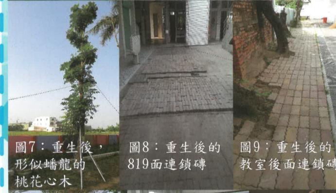
圖7：重生後，形似蟠龍的桃花心木