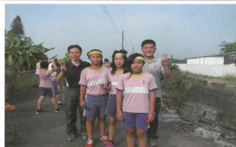
六年級女生前三名