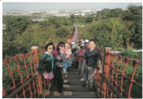
同仁於吊橋上合影

潔底山惡地形是南化泥岩層的延續，由於泥質岩層裸露，受雨水沖蝕，使得山坡陡峻，形成極有特色的地形景觀，有如恐龍脊；山上目前還有兩個小型噴泥口，位在中央山頭，直徑都很小，約三到五公分，山上除了碉堡還有其他多項軍事設施。傍晚時分是欣賞夕陽的好地方，好天氣有許多人架著相機等著拍夕陽之美。