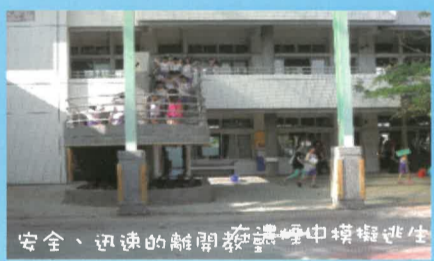
安全、迅速的離開教室中模擬逃生

阿蓮消防分隊及阿蓮婦女防火宣導隊到校協助辦理防火(災)教育及體驗活動，104年度於4月28日(二)上午體驗完成，今年分4站，讓全校小朋友體驗，分別為1.消防戰士(複合式防災常識宣導):從生動的影片畫面，增進小朋友的認知能力，深化消防常識。2.疑雲密布(煙霧體驗):讓小朋友體驗在火災現場，濃濃的煙霧，要如何降低身體姿勢，才能安全逃離。3.繪製家庭逃生路線圖:消防叔叔、阿姨指導小朋友，當在家中發生火災時，要如何逃生，請小朋友畫出正確的逃生路線圖。4.心技戰將(CPR心肺復甦術):消防隊帶來了3個安妮教具，在消防叔叔及婦宣隊阿姨操作指導下，5、6年級小朋友親自體驗，學習如何做CPR。