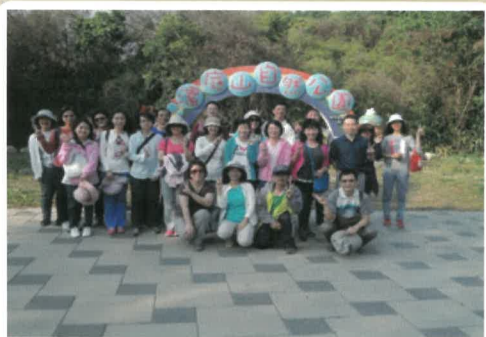
同仁於潔底山自然公園合影

3月18日學務處辦理教師環境教育研習，教職員工都參加，一起前往位於高雄市彌陀區的潔底山自然公園，標高53公尺，由於這裡長期是軍事管制區，在瞭望台下面種了一大片瓊麻，早期主要作為防禦空降部隊的入侵，從遠處眺望，潔底山都像一座不起眼的小山丘。直到潔底山下的蔦松文化遺址被當地人民發現，才使得這座我國最靠近海濱，且獨特的惡地形景觀漸漸受到矚目。開放後，彌陀區公所積極的建設，現在有了完善的步道及一條紅色的吊橋，平時許多附近居民會來運動，假日常有許多遊客來旅遊。