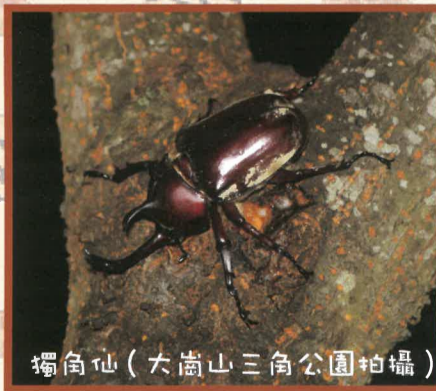
獨角仙(大崗山三角公園拍攝)

「老師，我們教室內有獨角仙和竹節蟲叻!」、「剛剛有一位叔叔送來這些動物」、「老師，我可不可以養?」、「我想要帶回家給家人看，可不可以?」...才一走進教室，四年級學生馬上就踴躍發言報告，原來四年級自然課第三單元有上到「認識昆蟲」這個單元，而這些的動物是書商業務送來讓學生近距離觀察用，相信許多大人一定會回憶起小時候辛苦採摘桑葉，飼養蠶寶寶的經歷。每次過年完後，書局收銀機櫃台前面就開始會擺放許多小動物販賣，有小老鼠、蠶寶寶、甲蟲、小烏龜...等，許多小孩子總是瞪大眼睛望著飼養箱內的可愛小動物，並懇求一旁的爸媽，是否可以買回家飼養?每次看到這種場景，都會讓我思考書局販售的是什麼?是可賺錢的商品?是可有可無的生命?還是幸福的飼養經驗?我認為更重要的是購買或飼養者的心態，雖然我們可以在飼養動物的過程中，我們可以從中學到很多東西，包含認識了解到動物的習性、生活環境、動物的一生，甚至可以學到如何面對死亡，有時寵物甚至可以變成人類心靈的夥伴，但我們卻更常看到因為人類的無知，而造成生物的傷害或死亡，例如經常把即將化蛹的獨角仙幼蟲翻出來觀察，將竹節蟲抓出來放在手上把玩，把蟻獅從沙坑中挖出來展示，這些舉動可能會讓獨角仙幼蟲無法羽化、竹節蟲斷腳、蟻獅死亡，人類無意的動作卻讓渺小的生物面臨威脅。回想上學期上自然課「水中生物」單元時，書商業務也送樹蛙來讓學生觀察，本來也是要拒絕，但想到可以讓學生親眼近距離觀察，可是見難得的體驗，但又考慮到如不想飼養，後續要如何處理，因為周遭環境並沒有該物種族群分布，也不能隨意放生，故要求書商業務必須回收才行。 這些教室內的活體生物教具對課程有其重要性，也具有教育意義，所以我們應該要更加尊重這些付出生命的大愛，用觀察取代把玩，用欣賞取代炫耀，不要再讓教室內成為這些生物的最終墳場。