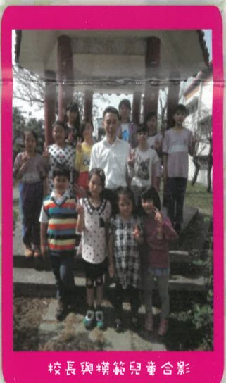
校長與模範兒童合影