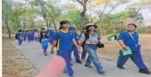
邁開步伐 浩浩蕩蕩拜訪自然生態園區的春天 在林蔭下 坐在砌石上 聽著「飛瓦傳奇」的故事