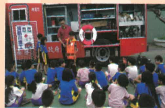
小朋友示範穿救生衣

學輔處每年的四月,都會和阿蓮消防分隊及阿蓮婦女防火宣導隊,合作辦理防火(災)教育及體驗活動,今年又邀請了茄萣及湖內消防分隊共襄盛舉,106年度於4月25日(二)上午體驗完成。今年分4站,讓全校小朋友體驗,分別為1.認識各式消防設備及器材:消防叔叔介紹一項又一項的消防設備,也說明使用的時機,更是讓小朋友來穿穿看,甚至爬到消防車上面體驗,滅火救人的英勇。2.疑雲密佈(煙霧體驗):讓小朋友在濃濃的煙霧中,體驗在火災現場的情形,一再宣導用濕抹布摀口鼻是錯誤的觀念,而是要如何降低身體姿勢,才能安全逃離火災現場。3.大家來找碴(找易致災點):消防叔叔及婦宣隊阿姨指導小朋友,要學生找找看,在家中甚麼情形或哪些地點是容易發生火災的地點,學生們分組對抗,拼命找、拼命的想,誰也不想輸誰,從活動中學習正確的防災觀念,相信透過腦力激盪,印象最深刻。4.心技戰將(CPR心肺復甦術):消防隊帶來了安妮教具,在消防叔叔及婦宣隊阿姨操作示範下,小朋友也能親自操作體驗,學習正確的CPR操作技能,相信這些小小的救命小子,在生活中,一定有能力保護自己和身邊的人。