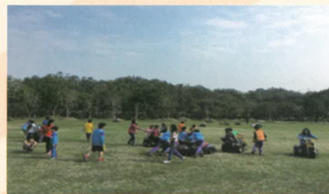
體驗草原電動車的樂趣