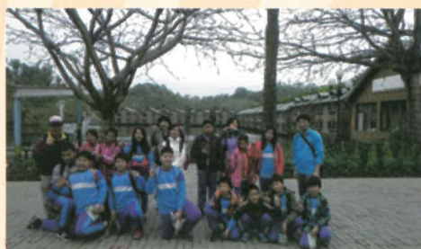
五年忠班師生合影