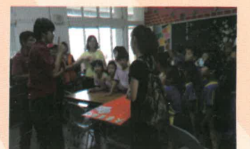
找易致災點,分組對抗