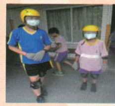
煙霧體驗裝備齊全