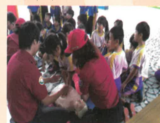
小朋友自己練習CPR技巧