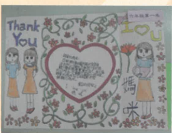
六孝王馨慧同學作品