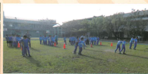
中年級蜈蚣競走比賽