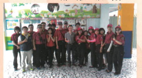
校長與消防隊的工作夥伴合影