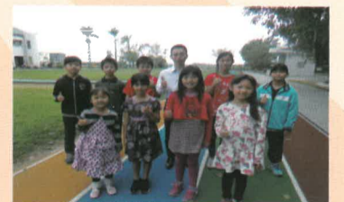
模範兒童與校長合影