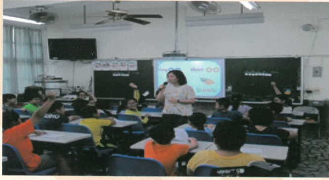
觀課班級:四忠 長音00和短音00之教學