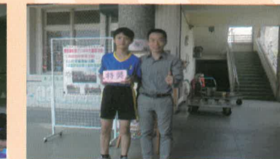
超好運的特獎同學與校長合影