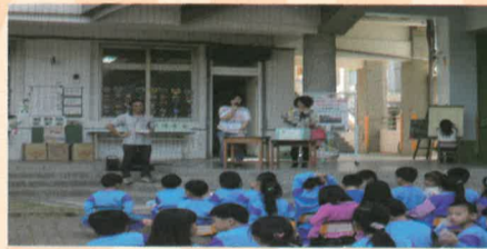
妙婷老師主持摸彩活動