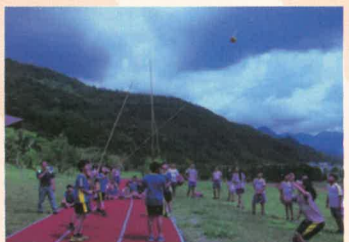
卡那卡那富族刺福球體驗 (由王光治主任指導)