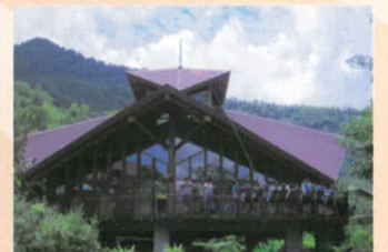
在曼陀羅花造型(變形金剛) 圖書館外 汲取大自然芬多精