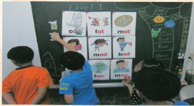
觀課班級:三忠 小朋友進行分組闖關