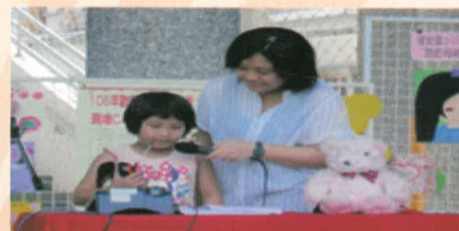
三孝洪藝芳call-out媽咪成功(現場參加)