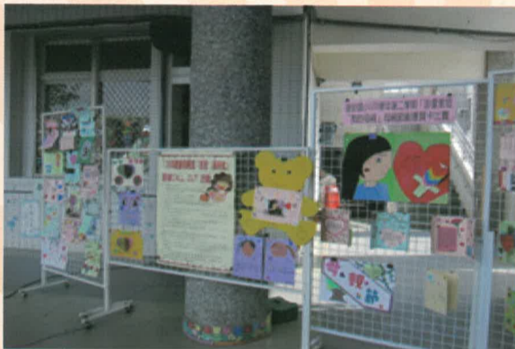
布置母親卡製作比賽優秀作品 琳瑯滿目