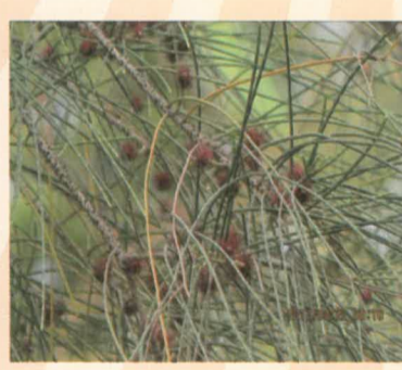
三月木麻黃綻開紅花