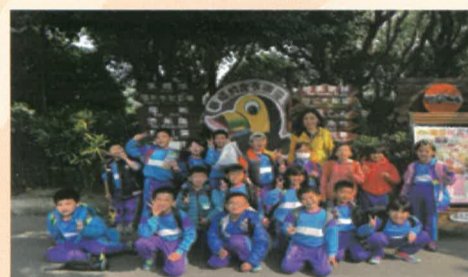
一年忠班師生合影