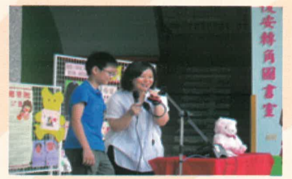
六忠高煜評call-out媽咪成功(現場參加)