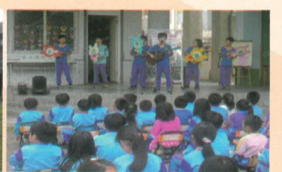
五孝信謙與班上同學的吉他表演