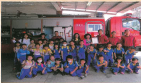
蘇木林分隊長 台英、淑慧、文媚與小朋友合影於消防隊