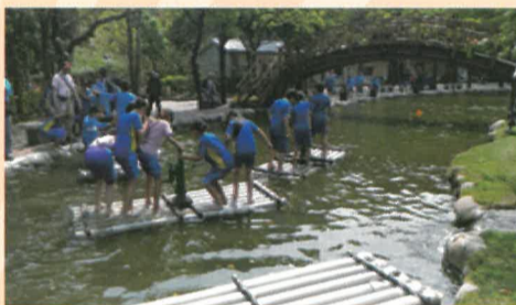
體驗難得的竹筏大賽