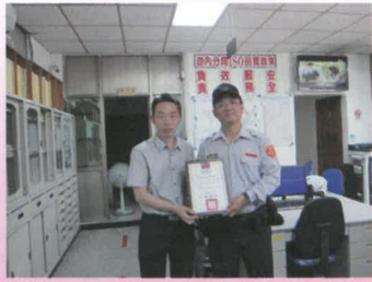
校長頒發感謝狀給阿蓮分駐所所長