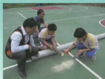
鋸檜木，阿哥哥功力不是蓋的