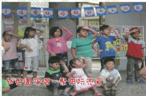
幼兒園演唱~繫來玩兜兜