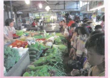
參觀阿蓮傳統菜市場