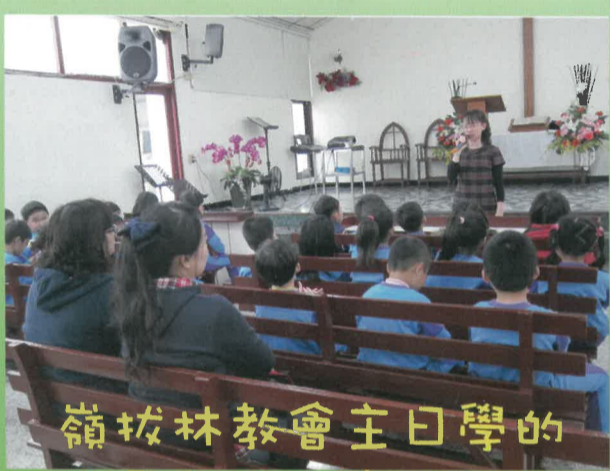
嶺拔林教會主日學的校長教小朋友唱聖歌