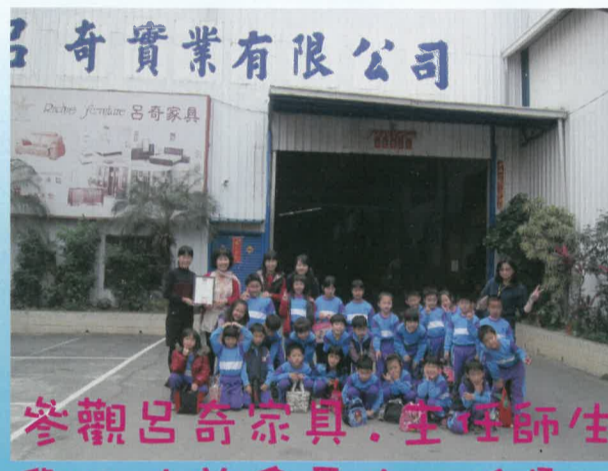
參觀呂奇家具，生理師生與二位前會長夫人合影