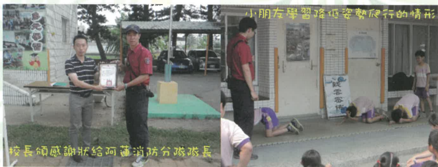
小朋友學習降低姿勢爬行的情形

學校每年請阿蓮消防分隊及阿蓮婦女防火宣導隊協助辦理防火(災)教育及體驗活動，103年度已於4月29日(二)上午體驗完成，今年分4站，讓全校小朋友體驗，分別為1.消防戰士(複合式防災常識宣導)：今年創新活動，讓小朋友能配合知能，進行體驗，深化消防常識。2.疑雲密佈(煙霧)：讓小朋友體驗火災現場，要降低姿勢，才能安全逃離。3.認識消防車及救護器材：在消防隊員一一介紹各項器材功能及使用，再作分組搶答，落實對消防器材的認識4.心技戰將(CPR心肺復甦術)：消防隊帶來的安妮教具，在消防叔叔及婦宣隊阿姨操作指導下，也讓小朋友親自學習如何做CPR。