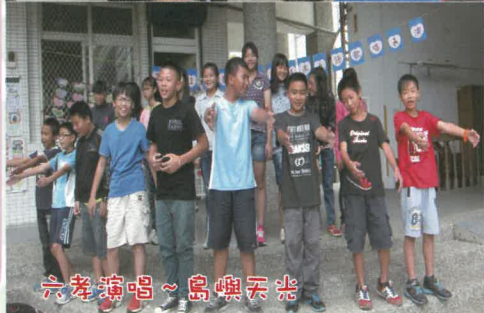
六孝演唱~島嶼天光