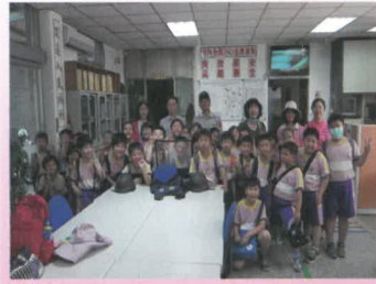
二年級小朋友受到特別禮遇，和所長校長師長們合影