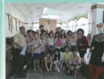
五忠在民權國小林主任導覽熱心的林主任向五孝師生，下，大開眼界，合影於文物館 專業介紹那瑪夏文物館