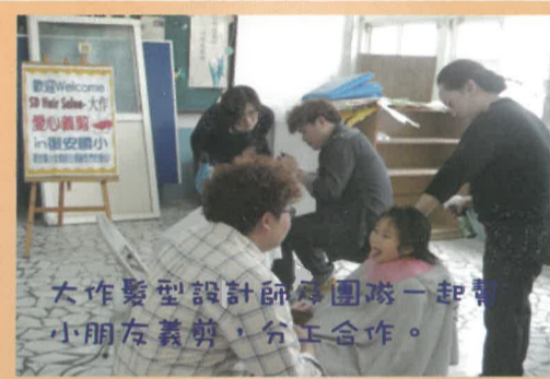
大作髮型設計師與團隊一起幫小朋友義剪，分工合作。

「大作髮型設計髮廊」於103年3月4日，大作髮型設計師帶著他的團隊到學校幫學生義剪，從午休忙到將近下午5點，義剪完40位學生的頭髮。