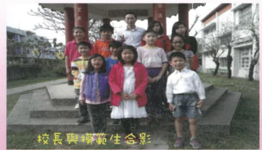
校長與模範生合影