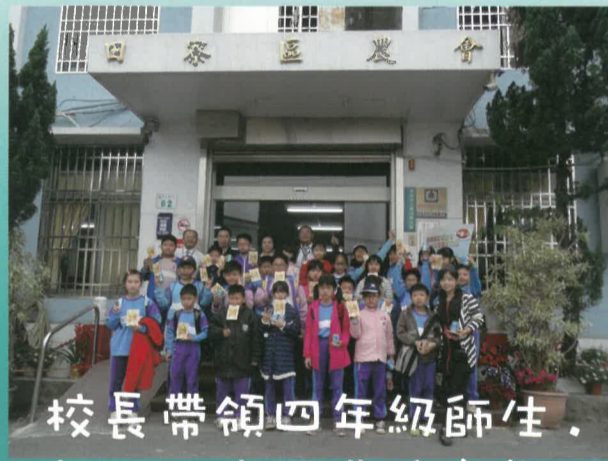
校長帶領四年級師生，蒞臨田寮區農會參觀