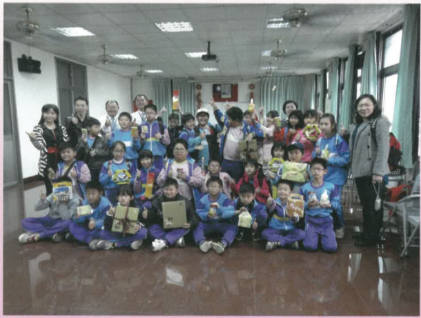
蜂產品琳瑯滿目，讚哦

你有品嚐過羊奶冰淇淋及泥火山冰淇淋嗎？在略帶寒意的3月21日，品嚐這二種冰淇淋更是「別有一番滋味在心頭」呀！