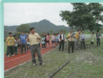
皇原老師是射山豬高手