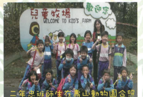
二年忠班師生在壽山動物園合照