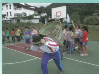
體驗原住民以頭額負重，不簡單