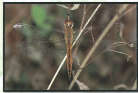
↑薄翅蜻蛉(雄) ↓線紋蜻蛉進食