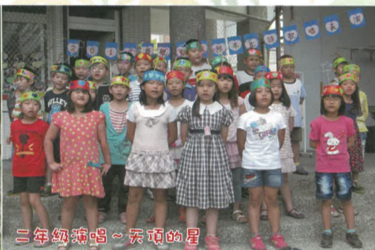
二年級演唱~天頂的星

一年一度的母親節，在溫馨的五月歡慶，學務處辦「話」我媽媽—母親卡製作比賽，小朋友從家中的壓箱寶，找出珍貴的老照片，寫上感恩、祝福的話，送給偉大的媽媽，將作品與大家分享。高雄市阿蓮區復安國小102學年度第二學期「製作母親節卡片」學生美術比賽得獎名單