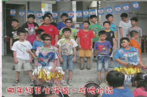
四年級男生演唱~阿嬤的話