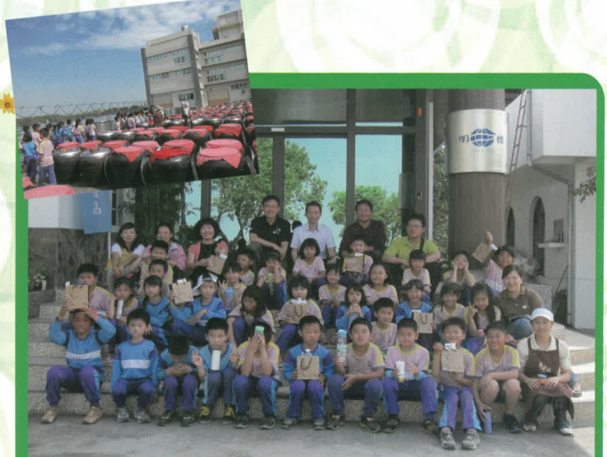
三年級小朋友收穫滿行囊，與校長、劉副總經理、師長們合影

這次小朋友更是收穫多又多，除了大開眼界看到純古法釀造豆瓣醬的神秘面纱，在進行有獎徵答動作迅速且答對的小朋友，更是人手一袋神秘禮物~明德老醬鋪的精緻產品。我端詳著小小書籤寫的「台灣醬來，美好味來。」若有所思，這正是產業界的信念與堅持吧！