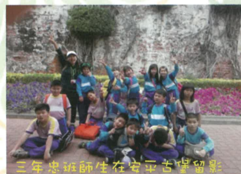
三年忠班師生在安平古堡留影

102學年度1-5年級校外教學活動，經過老師的討論，規劃在103年4月1日(星期二)辦理，1、2年級校外教學地點：高雄市立壽山動物園、高雄市立兒童美術館；3、4、5年級校外教學地點：國立台灣歷史博物館、安平古堡、安平樹屋、德記洋行、德陽艦。老師們帶著學生走出校園，把教室延伸，拓展視野，深化學生自然與人文的素養。