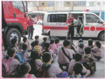
消防叔叔向小朋友介紹火場英雄的配備