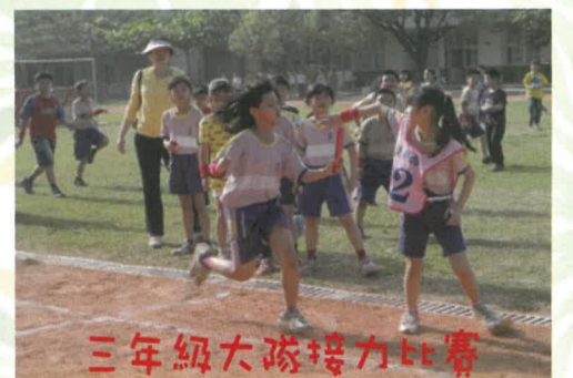
三年級大隊接力比賽