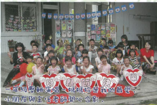
一年級壓軸演唱~媽媽你是我的最愛，小朋友與主任老師開心合影。