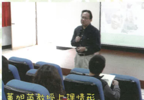
董旭英教授上課情形

本校獲教育部推動教育優先區計畫的經費補助，辦理親職教育講座，103年3月22日(六)上午邀請成功大學教育研究所所長董旭英教授，教授運用一早上的時間，與家長們分享「貼心父母—陪孩子一起成長」，獲家長的熱烈迴響。